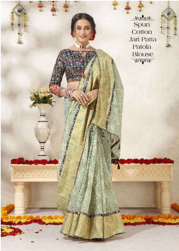
Spun Cotton Jari Patta Patola Blouse