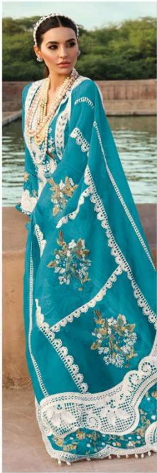
D.NO. 196 H