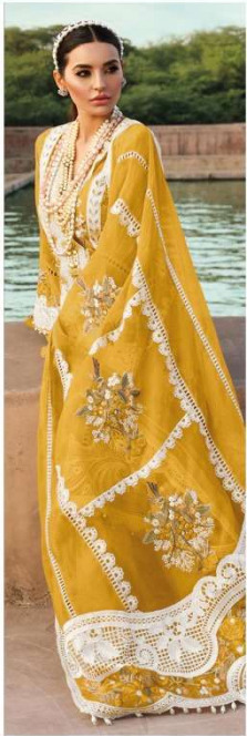
D.NO. 196 F