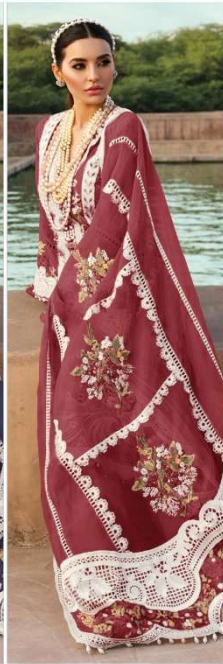
D.NO. 196 J