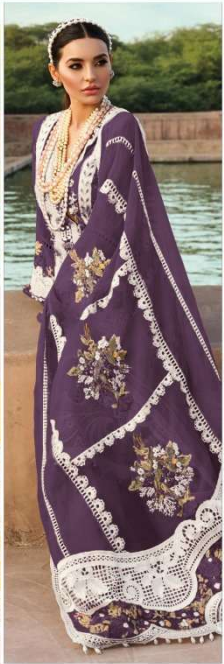
D.NO. 196 G