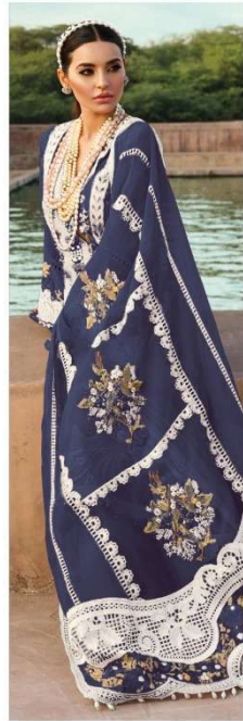
D.NO. 196 I