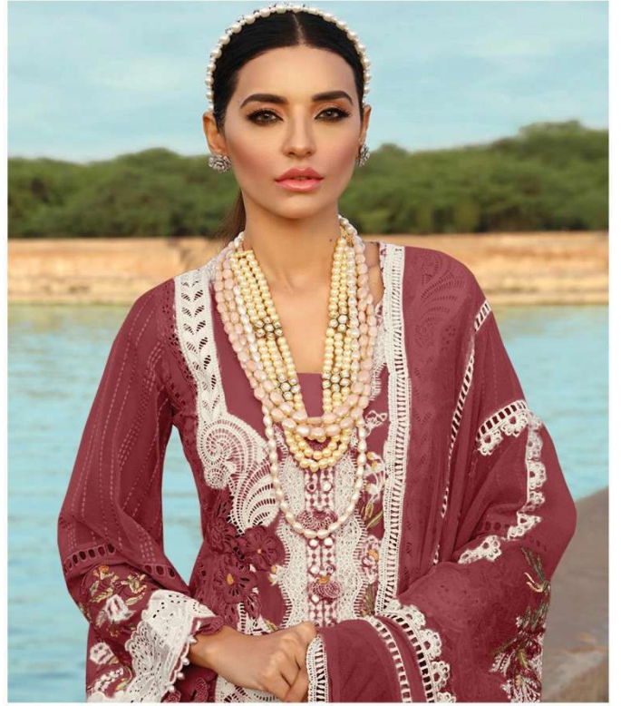
D.NO. 196 J