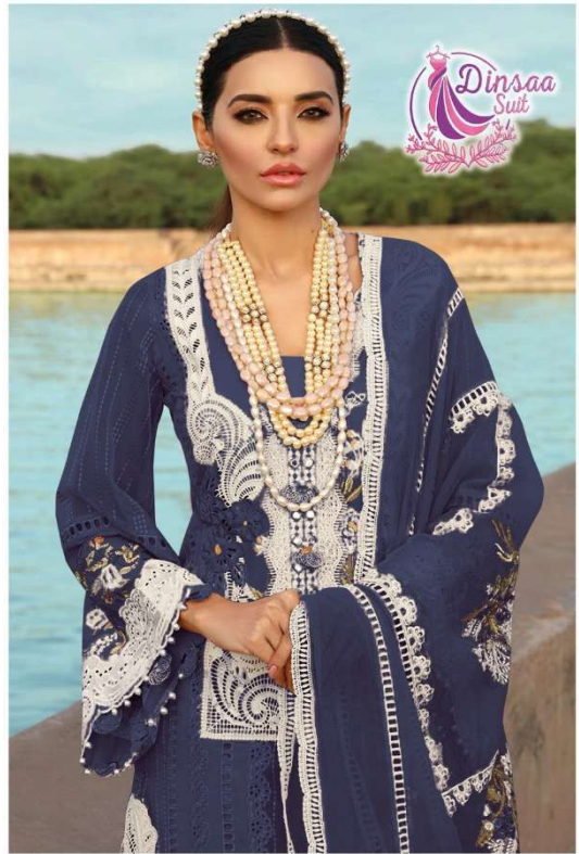
D.NO. 196 I