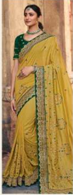
• 1106 •