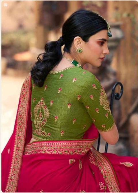
• 1112 •