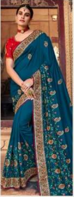
• 1105 •