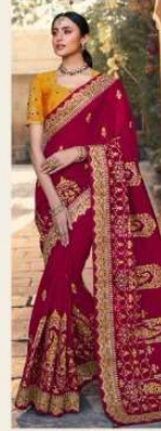
• 1114 •