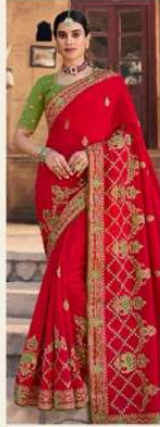
• 1107 •