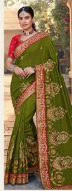
• 1108 •