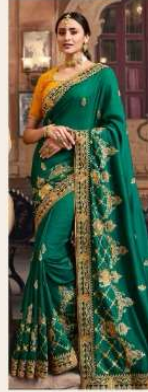
• 1113 •