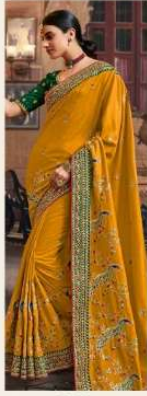
• 1102 •