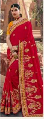
• 1101 •