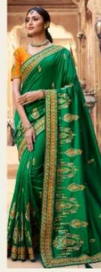
• 1110 •