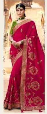
• 1112 •