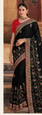
• 1111 •