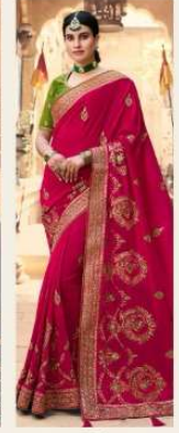
• 1112 •