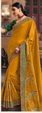
• 1102 •