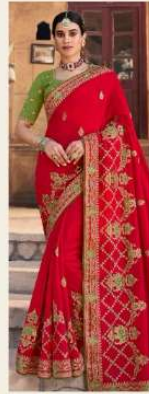
• 1107 •