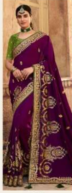
• 1103 •