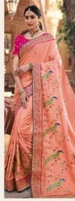
• 1109 •