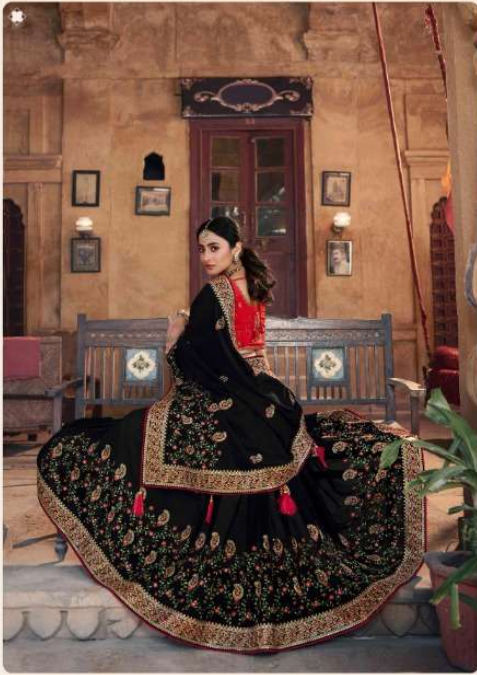
• III •