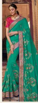
• 1104 •