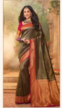
◆ 1511 ◆