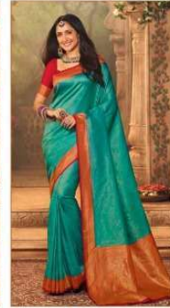
◆ 1510 ◆