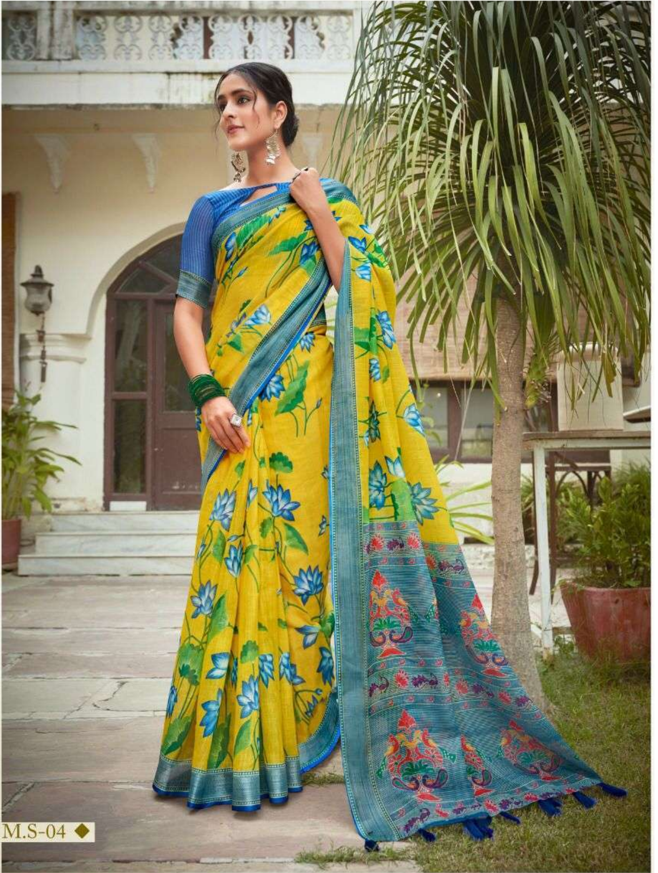
◆ M.S-04 ◆