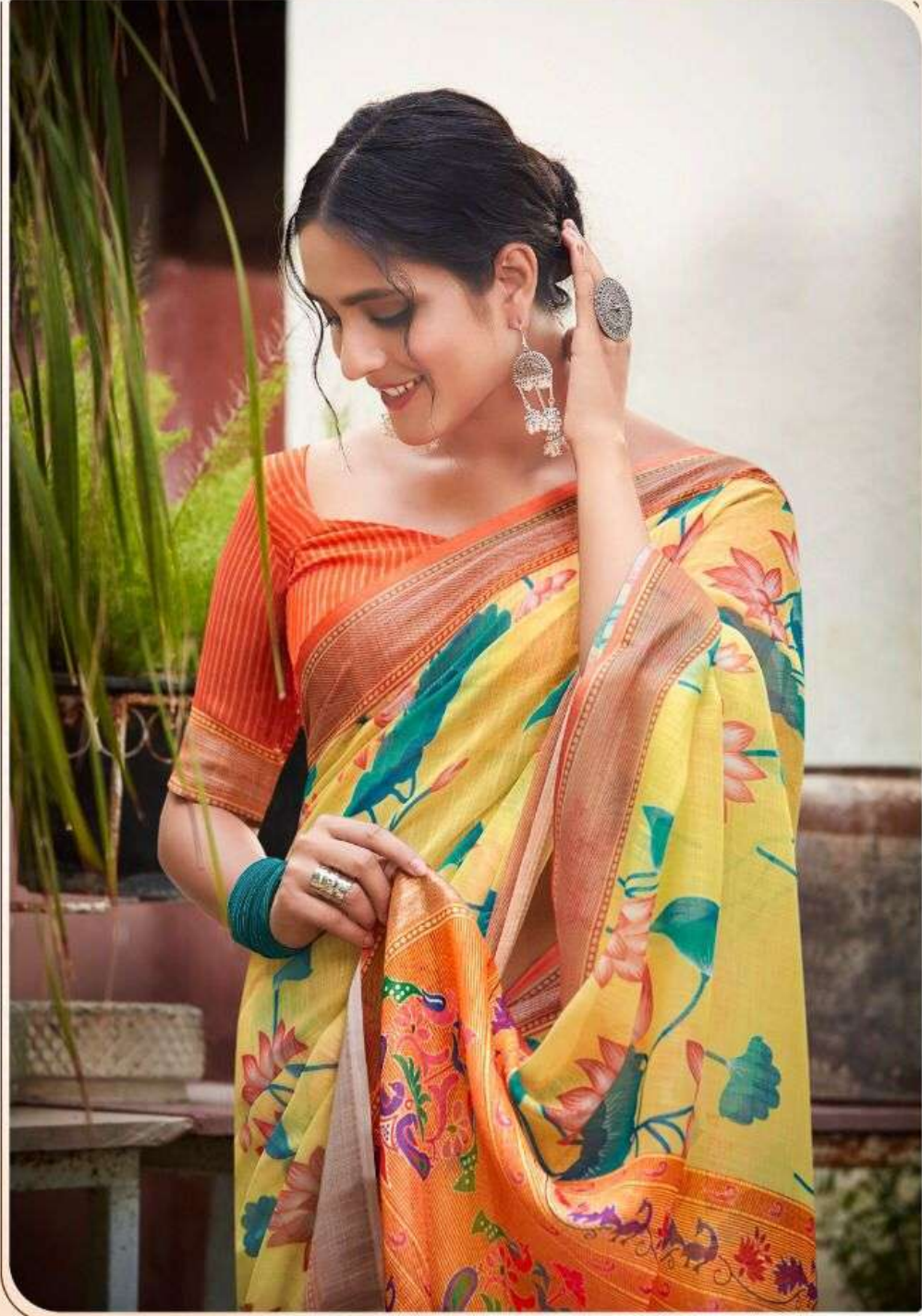
◆ M.S-07 ◆