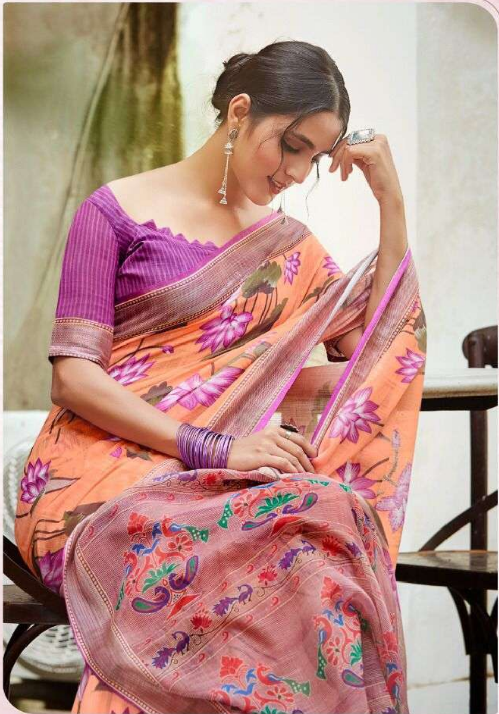
◆ M.S-03 ◆