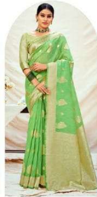
|| 1005 ||