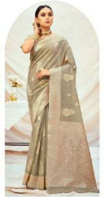
|| 1006 ||