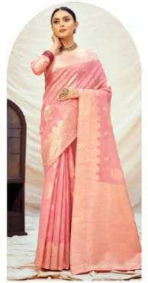
|| 1003 ||