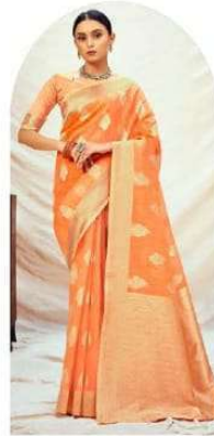
|| 1004 ||