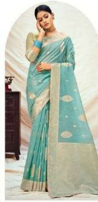
|| 1002 ||