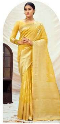
|| 1001 ||